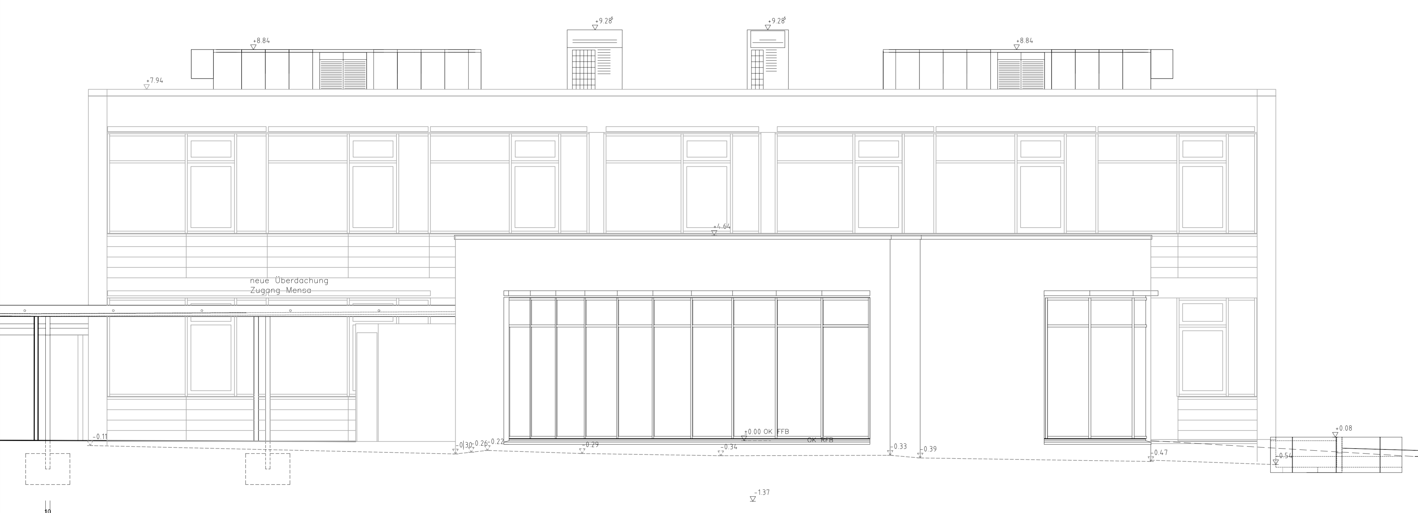
Ansicht von Norden